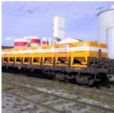
Carbide Sweden AB acetylene fabrication - just add water