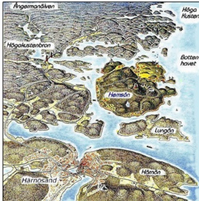
Hemsö fästning, ett miljardbygge. Bombsäkert besöksmål.

Egen buss, avresa från Stockholm torsdag 8/9 kl 17, åter söndag 11/9. Vi bor på STF:s vandrarhem i Sundsvall. Pris 2.900 kr.