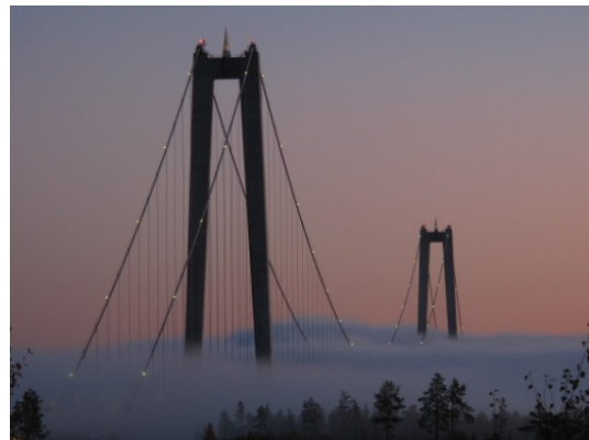
Högakustenbron Vi kommer in i bron under vägbanan och in i bergrummet i ena landfästet.

Gloss is the attribute of a surface, that makes the object look shiny. At Ortviken Gloss is measured with an angle of 75°.